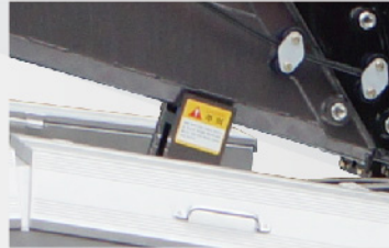
플 자동 격납 시스템(자동 원점 복귀 시스템)