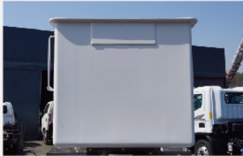
FRP 버킷 장착가능(추가옵션)